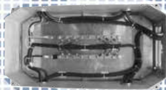
Ilustração com uso de flange (janelas)